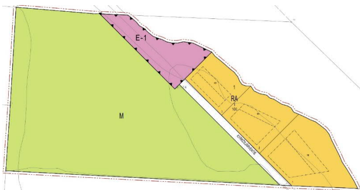
Kuva 5. Alustava vaihtoehto.

Loma-asuntojen korttelialue RA on rakennusoikeutta 100 k-m 2 rakennuspaikkaa kohden. Patoalue on merkattu (E-1) erityis-alueeksi ja loput kaava alueesta (M) maa- ja metsätalousalueeksi.