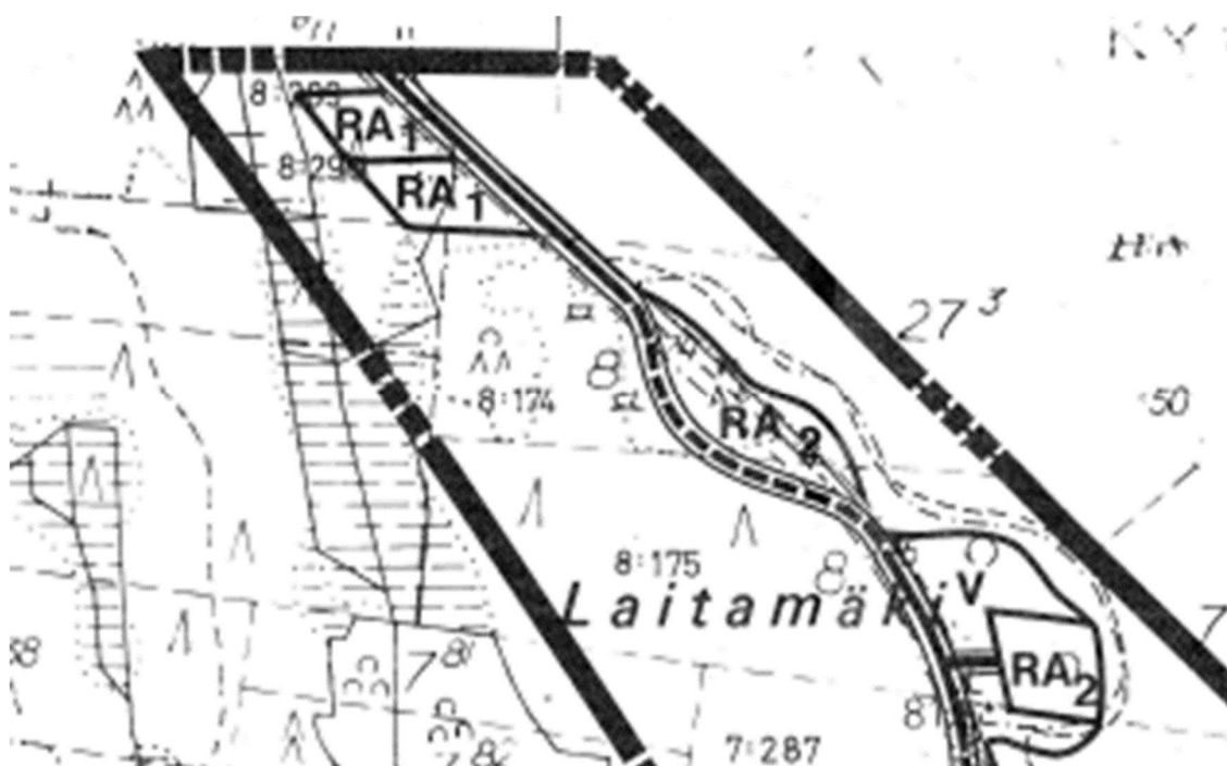
Kuva 4. Ote yleiskaavasta 27.5.1985

Rakennuspaikkoja ei saa sijoittaa siten, että yhdystie johtaa rakennuspaikan poikki