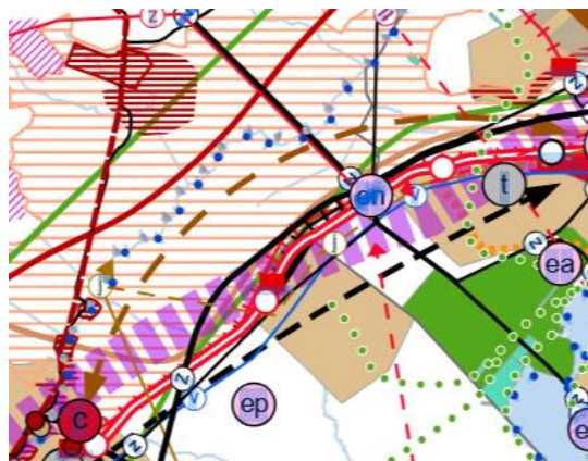
Ote maakuntakaavasta suunnittelualueen läheisyydestä

Kaava-alueella koskevat Ahonkylän taajamatoimintojen alue ja Seinäjoen kaupunkikeskuksen kehittämisvyöhyke.