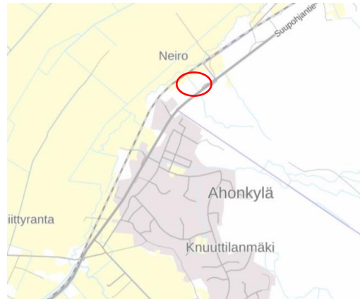
Suunnittelualueiden seudullinen sijainti